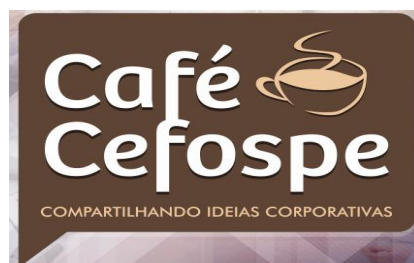
Logomarca do Projeto